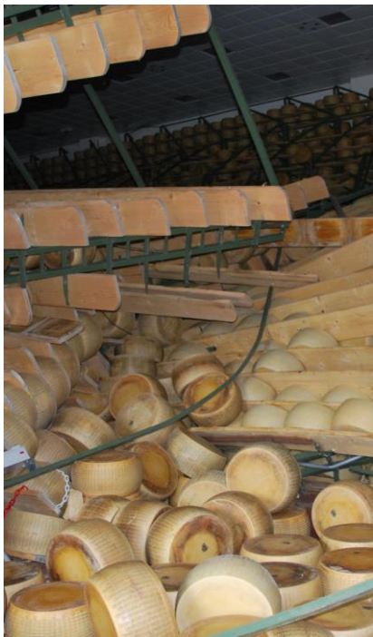
Terremoto, Emilia 12 Maggio 2012