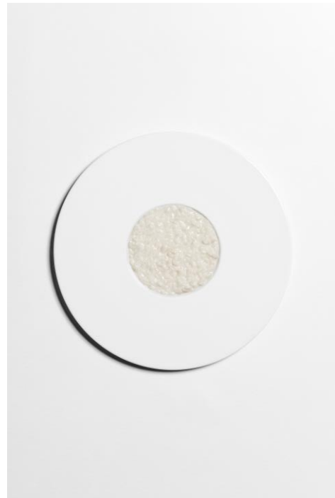
Riso cacio e pepe