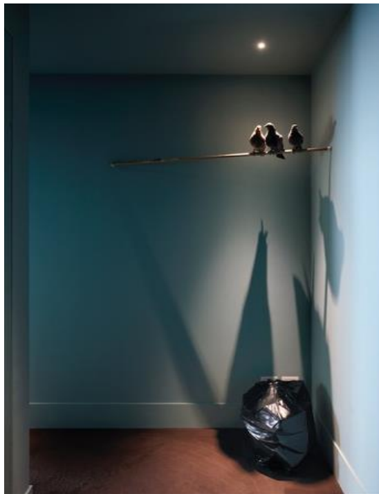
Turisti Maurizio Cattelan