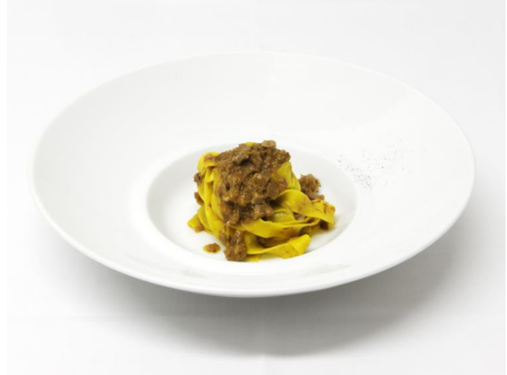
Tagliatelle al ragù