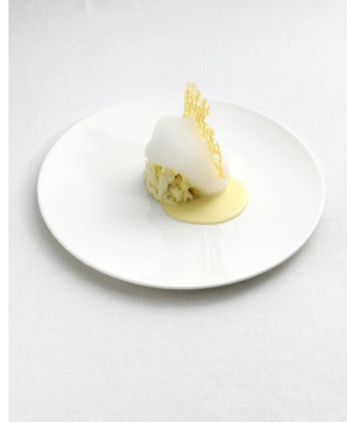
Cinque stagionature del Parmigiano Reggiano in diverse consistenze e temperature