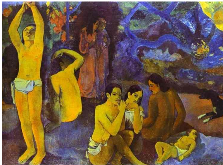
Da dove veniamo? Chi siamo? Dove andiamo? Paul Gauguin