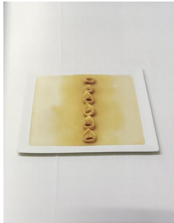
Tortellini che camminano sul brodo