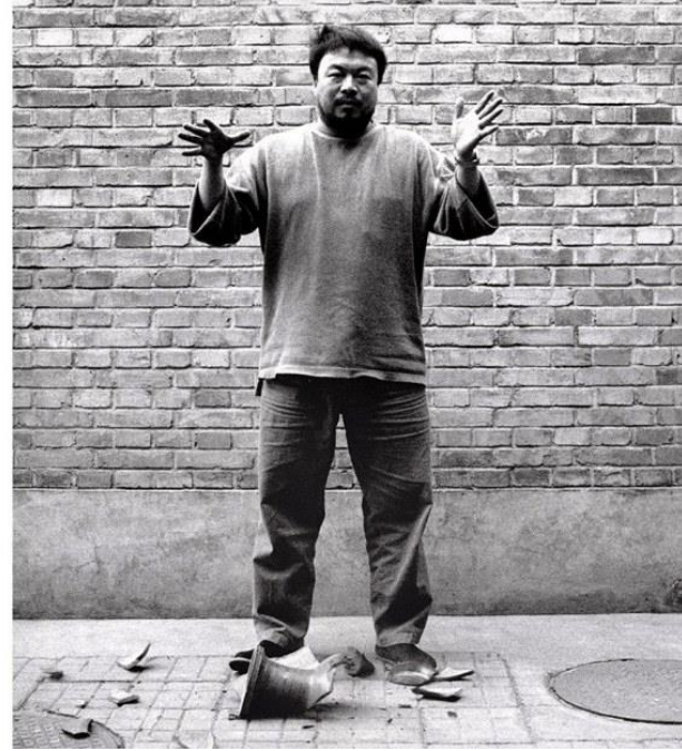
Dropping a Han Dynasty Urn Ai Weiwei