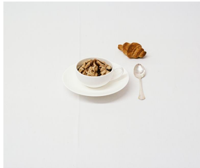
Cappuccino di patate e porri Brioche di ciccioli frolli con crema di mortadella